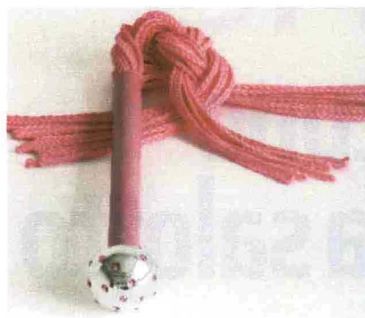
Dall'alto, mascherina in pelle di struzzo viola e nastri color cipria di Angélique Devil; in platino e di design il vibratore da borsetta; si chiama Shiri-Zinn la frusta rosa con pomello in argento e brillantini.